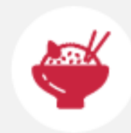
Рис +12 сомов