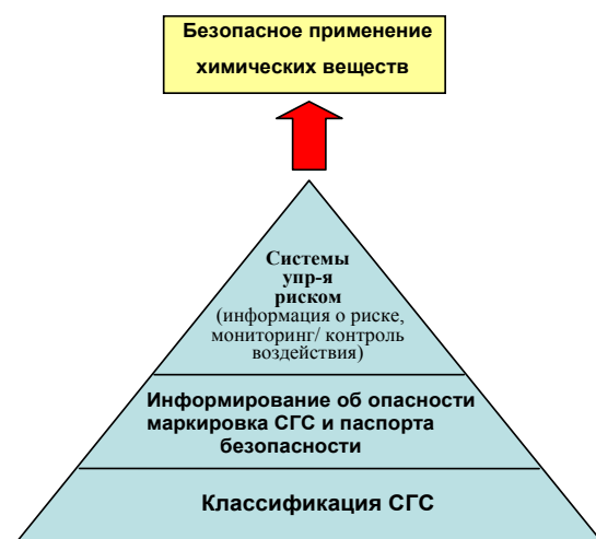
Рисунок 1. СГС как основа национальной системы контроля химических веществ

Классификация и маркировка СГС могут рассматриваться как основа программ, гарантирующих безопасное применение химических веществ (см. рисунок 1 ниже). Два первых шага любой программы, призванной обеспечить безопасное применение химических веществ, – это определение присущего веществу уровня опасности (т.е. классификация) и затем передача этой информации. Элементы сообщений, применяемые в СГС, отражают разные потребности различных целевых групп, например, работников и потребителей. Как показано далее в пирамиде, некоторые национальные программы также включают систему управления риском как часть общей программы эффективного контроля химических веществ. Общей задачей таких систем является минимизация воздействия, ведущая к снижению риска. Независимо от наличия формальной системы управления риском, СГС предназначена для содействия безопасному применению химических веществ.